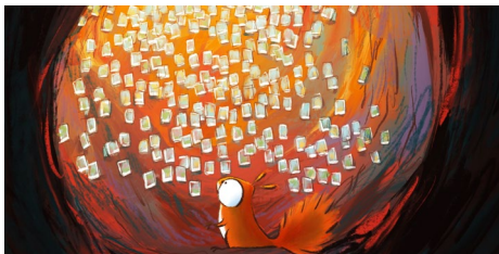
Tête en l'air de Rémi Durin. Programme Mon monde imaginaire .

Rien n'arrête l'imagination ! La preuve en 5 histoires où tout devient possible.