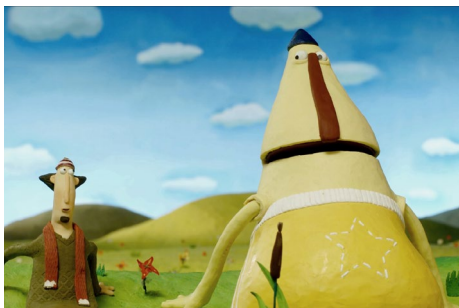
Le génie de la boîte de raviolis de Claude Barras. Programme Qui mange quoi ?

Petits et grands, animaux et créatures en tous genres : tout le monde est invité à notre super festin en images !