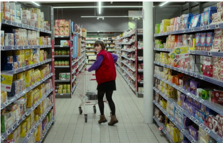
Partir un jour de Amélie Bonnin. Programme En haut de l'affiche.

Cette séance est proposée en version audiodécrite en partenariat avec Le Cinéma Parle, avec le soutien de Matmut pour les Arts. Elle sera accessible pour les personnes déficientes visuelles grâce à l'application La Bavarde, avec le concours de l'association Valentin Haüy.