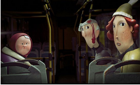
Busline35A de Elena Felici. Programme Penser l'humanité .