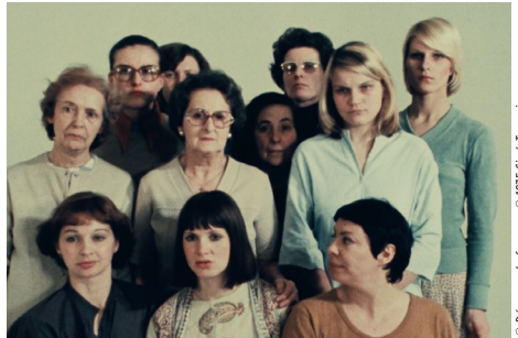
© Réponses de femmes © 1975 Ciné-Femmes.

Lorsque les femmes cisgenres tournent la caméra vers elles-mêmes : tour d'horizon des documentaristes et essayistes des années 70-80.