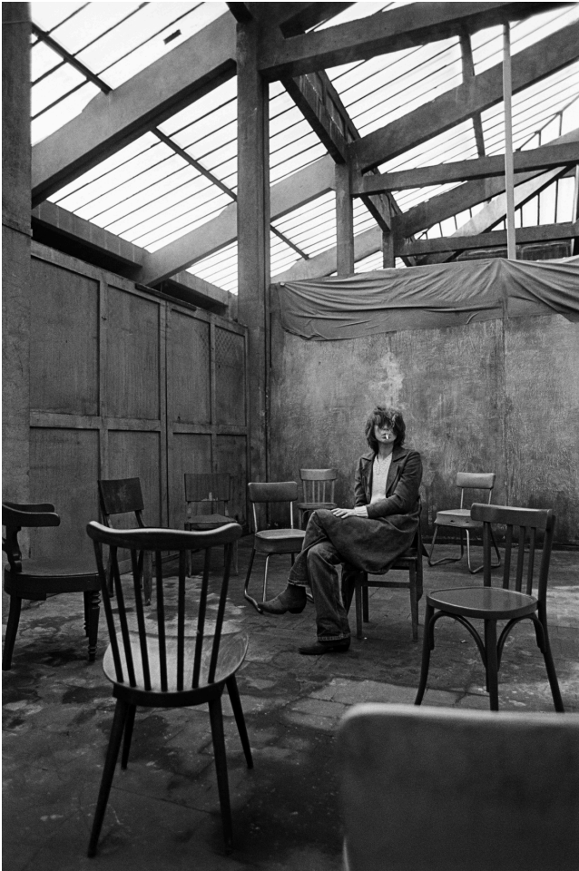
Autoportrait pour Elle, 2000, Fonds Kate Barry, coll. musée Nicéphore Niépce, Chalon-sur-Saône