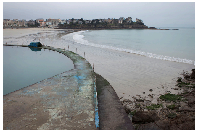
Dinard, 2012