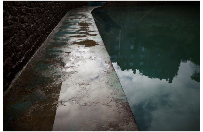
Dinard, 2012