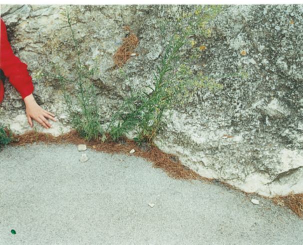
Mauvaises herbes , 2006, Fonds Kate Barry, coll. musée Nicéphore Niépce, Chalon-sur-Saône