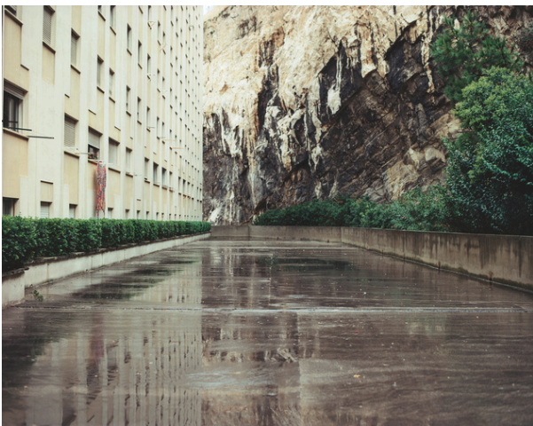
Paysage (Marseille), 2002-2008