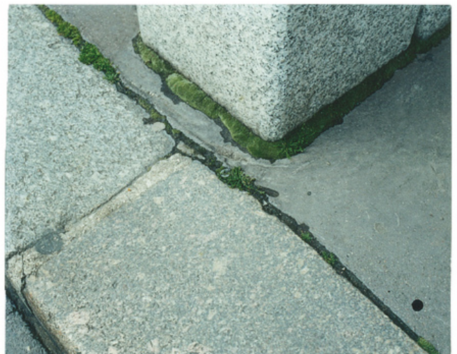
Herbes folles , 2008