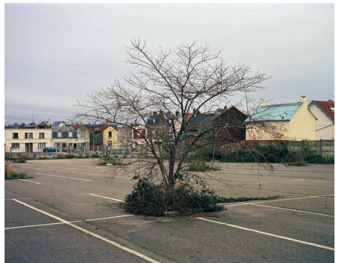
Paysage, 2002-2008