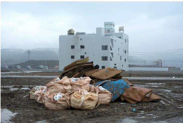
Japon, décembre 2012