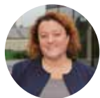
Frédérique CALANDRA Maire du 20 e arrondissement